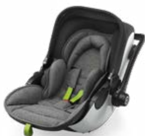
Super Green 41942EL173