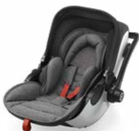
Hot Red 41942EL171