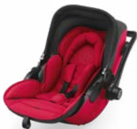
Chili Red 41942EL126