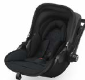
Mystic Black 41942EL123