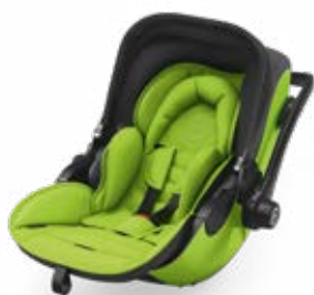
Spring Green 41942EL127

Otro aspecto a destacar es el diseño. Los puntos representan un mensaje especial en código Morse: "Kiddy. We love our kids." ¡Único e inconfundible!