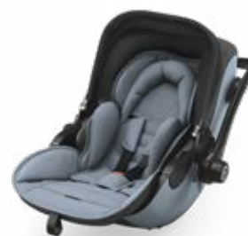
Polar Grey 41942EL125