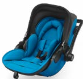
Summer Blue 41942EL121