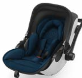
Mountain Blue 41942EL124