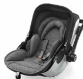
Icy Grey 41942EL170