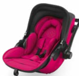
Berry Pink 41942EL120