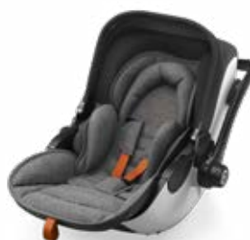
Safe Orange 41942EL172